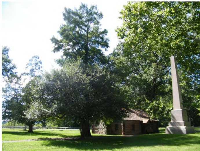
Místo, kde se odehrál masakr v Gnadenthuettle