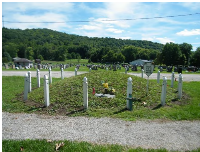
Místo s ostatky devadesátišesti Zeisbergerových indiánů